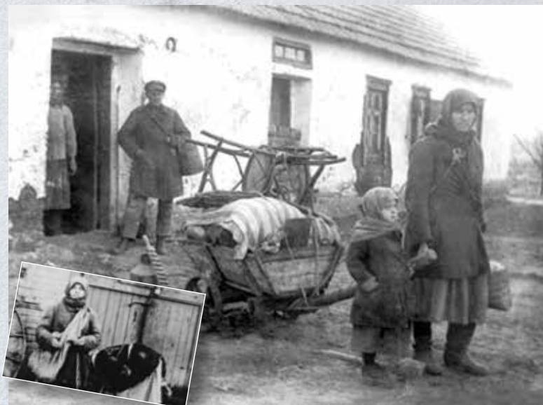
Сцени еміграції, зняті під час Голодомору в Україні

Згодом вшанування пам'яті жертв Голодомору українською громадою Хорватії почало корелюватися із запровадженими традиціями в Україні. Слід згадати, що в Україні було прийнято кілька законів поспіль щодо зміни назв Дня вшанування жертв Голодомору. Так, першим указом Президента України Леонідом Кучмою №1310/98 від 26 листопада 1998 року було запроваджено «День пам'яті жертв голодоморів». Новим указом Л.Кучми № 1181/2000 від 31 жовтня 2000 року встановлювалася назва «День пам'яті жертв голодомору та політичних репресій», а указом Л.Кучми № 797/2004 від 15 липня 2004 року – «День пам'яті жертв голодоморів та політичних репресій». Остаточна назва Дня була прийнята відповідно до указу президента Віктора Ющенка № 431/2007 від 21 травня 2007 р. і з того часу закріпилася назва «День пам'яті жертв голодоморів» 9 .