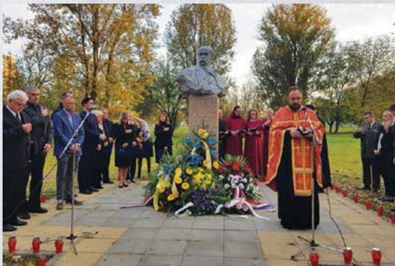
Вшанування пам'яті Голодомору в Загребі біля пам'ятника Т. Шевченку

Заява В.Януковича була зроблена навіть всупереч оцінки Голодомору в Україні міжнародними інституціями. Зокрема, ще 23 жовтня 2008 р. у Страсбурзі була прийнята Резолюція Європейського Парламенту щодо визнання Голодомору штучним голодом в Україні 1932–1933 років, у якій говориться, що: Європейський Парламент... Враховуючи те, що Голодомор 1932–1933 рр., який спричинив загибель мільйонів українців, був цинічно та жорстоко спланований сталінським режимом з метою насильницького запровадження Радянським Союзом політики колективізації сільського господарства всупереч волі сільського населення України... 1. Звертається до українського народу та зокрема до тих, хто вижив під час Голодомору, сімей та родичів жертв, і... визнає Голодомор (штучний голод 1932–1933 років в Україні) жахливим злочином проти народу України та людяності 32 .