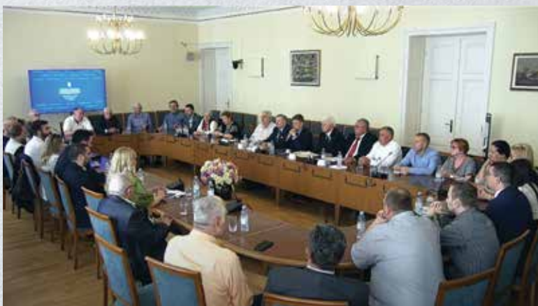
Круглий стіл на тему «Голодомор – геноцид українського народу», Загреб, 2023 р.