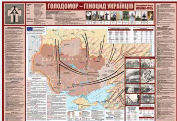
Картографічне зображення Голодомору