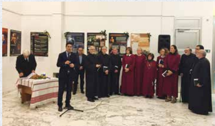
Пам'ять про Голодомор у Загребі зі спеціальною музичною програмою Загребського хору Кирила і Методія

У 2015 році Посол України Олександр Левченко, окрім заходів, що проводила громада українців Загреб, відвідав також пам'ятний вечір у товаристві української діаспори «Карпати» у Липовлянах. У цьому ж році заходи із вшанування жертв Голодомору 1932-1933 рр. відбулися у багатьох осередках української громади в Хорватії. Зокрема у містах Рієка, Славонський Брод, Вуковар, Канижа, Шумече 40 .