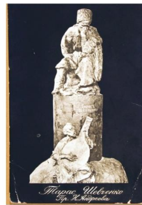
8. Проект пам'ятника Т. Г. Шевченку в Києві. Автор — М. А. Андреев. 1914 р. Поштова листівка. З фондів Національного музею Тараса Шевченка в Києві.