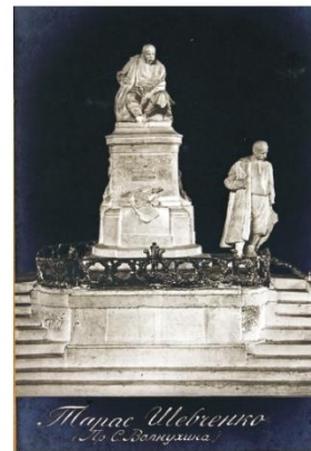
7. Проект пам'ятника Т. Г. Шевченку в Києві. Автор — С. В. Волнухін. 1914 р. Поштова листівка.