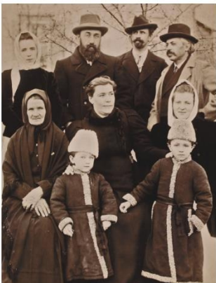
3. Борис Грінченко (стоїть другий зліва) й Марія Грінченко (сидить в центрі) у колі родини земського діяча Андрія Балики (стоїть третій зліва) та у присутності поета Володимира Самійленка (стоїть першим справа) під час перебування в Чернігові. Інститут Рукопису Національної бібліотеки України ім. В. І. Вернадського (ІР НБУВ). Ф. 170. Оп. 1. Спр. 761.