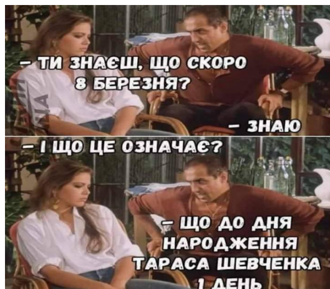
Рисунок 2. Мем про переосмислення 8 березня

На рисунку 1 ми бачимо мем, що напряму стосується питання історії України та в гумористичному ключі зображує складне питання створення національної держави після революції та розпаду Російської Імперії. Цю світлину було взято з доволі симптоматичної статті під назвою «Наступний підручник з Історії України має бути з мемів або це буде мемопідручник», де автор пропонує вивчати історію за допомогою мемів[3]. Це також яскравий прояв історичної пам'яті, адже тут ми бачимо, що комплексний процес побудови національної держави зводиться до відчуття того, що в той період Україні не вистачило єдності для успішного завершення Української революції.