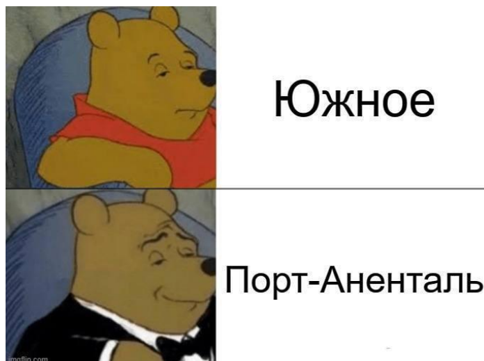
Рисунок 3. Мем про зміну назви міста

контексту, але цей мем є частиною ширшого культурного контексту, що дозволяє його розшифрувати спираючись на попередній досвід.